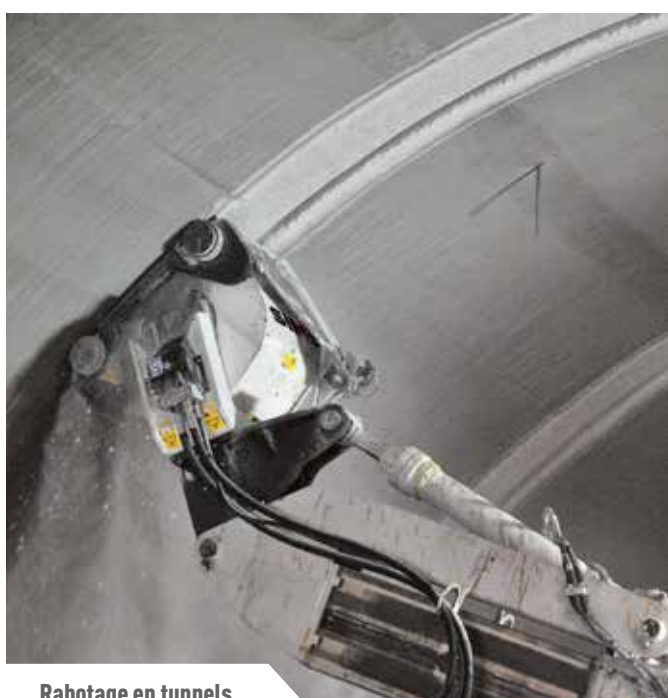
Rabotage en tunnels