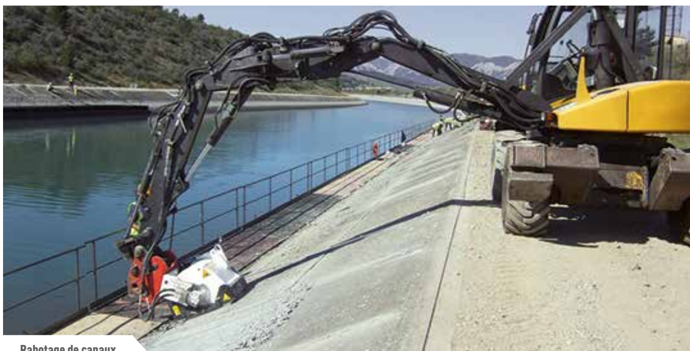
Rabotage de canaux